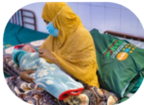
الاستجابة الإنسانية لصندوق الأمم المتحدة للسكان في اليمن 2024