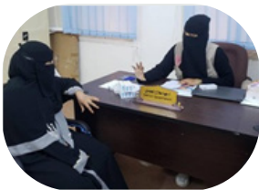
كسر الحلقة المفرغة للناجيات من الختان: اقرأ المزيد ...