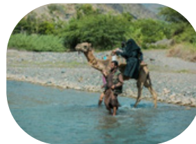
الجمال تقوم محل سيارات الاسعاف في اليمن